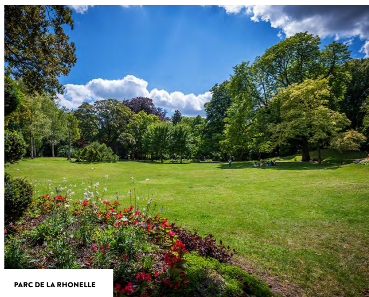
PARC DE LA RHONELLE

Pratique, l'hypermarché Auchan se situe à 2 minutes en voiture seulement de la résidence.