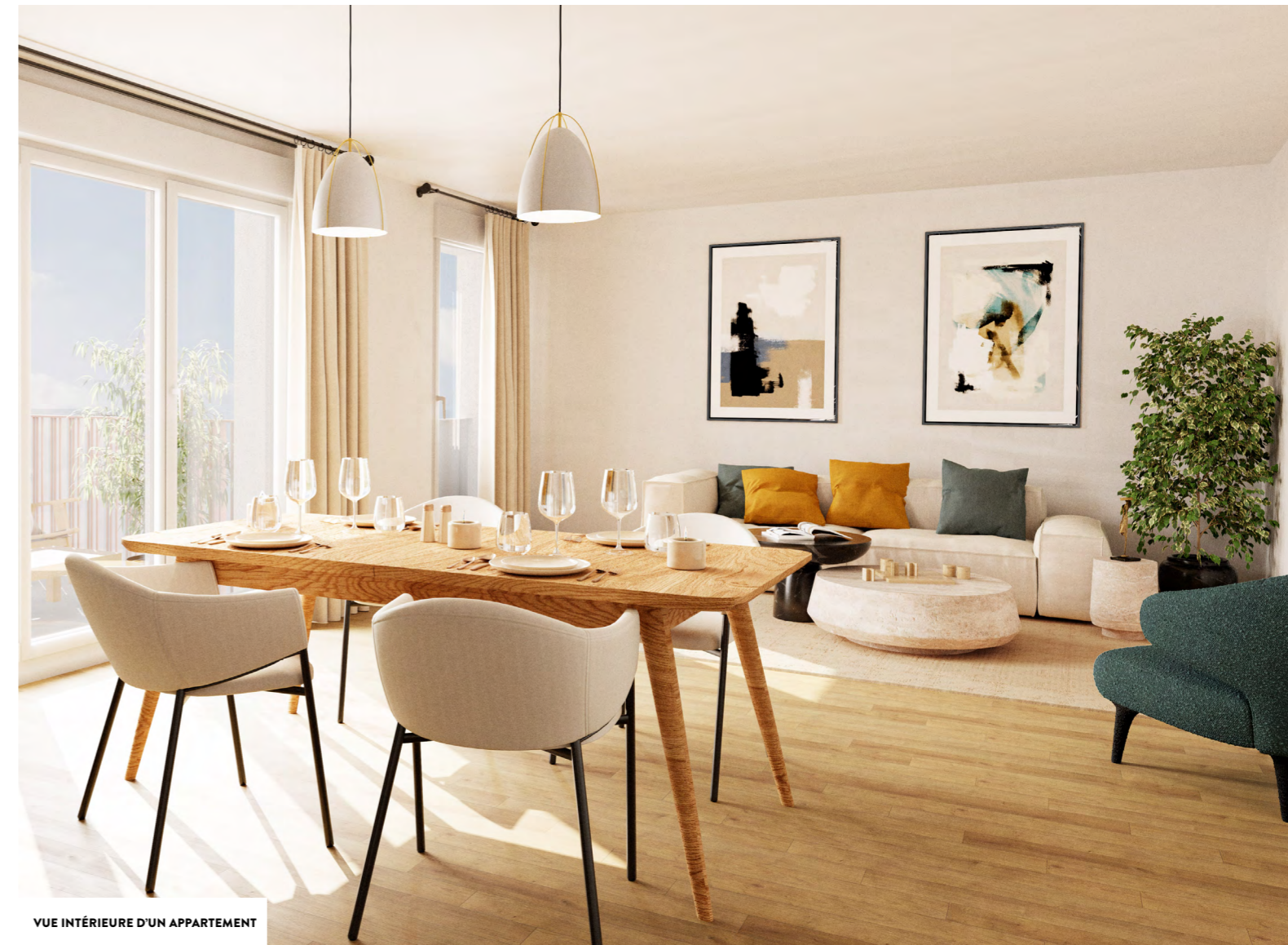
VUE INTÉRIEURE D'UN APPARTEMENT