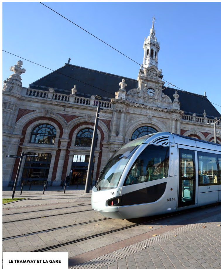
LE TRAMWAY ET LA GARE

Pour les amateurs de nature et de sport, le parc de la Rhônelle, le complexe Nungesser ou encore les bords de l'Escaut invitent à la détente et aux activités en plein air.