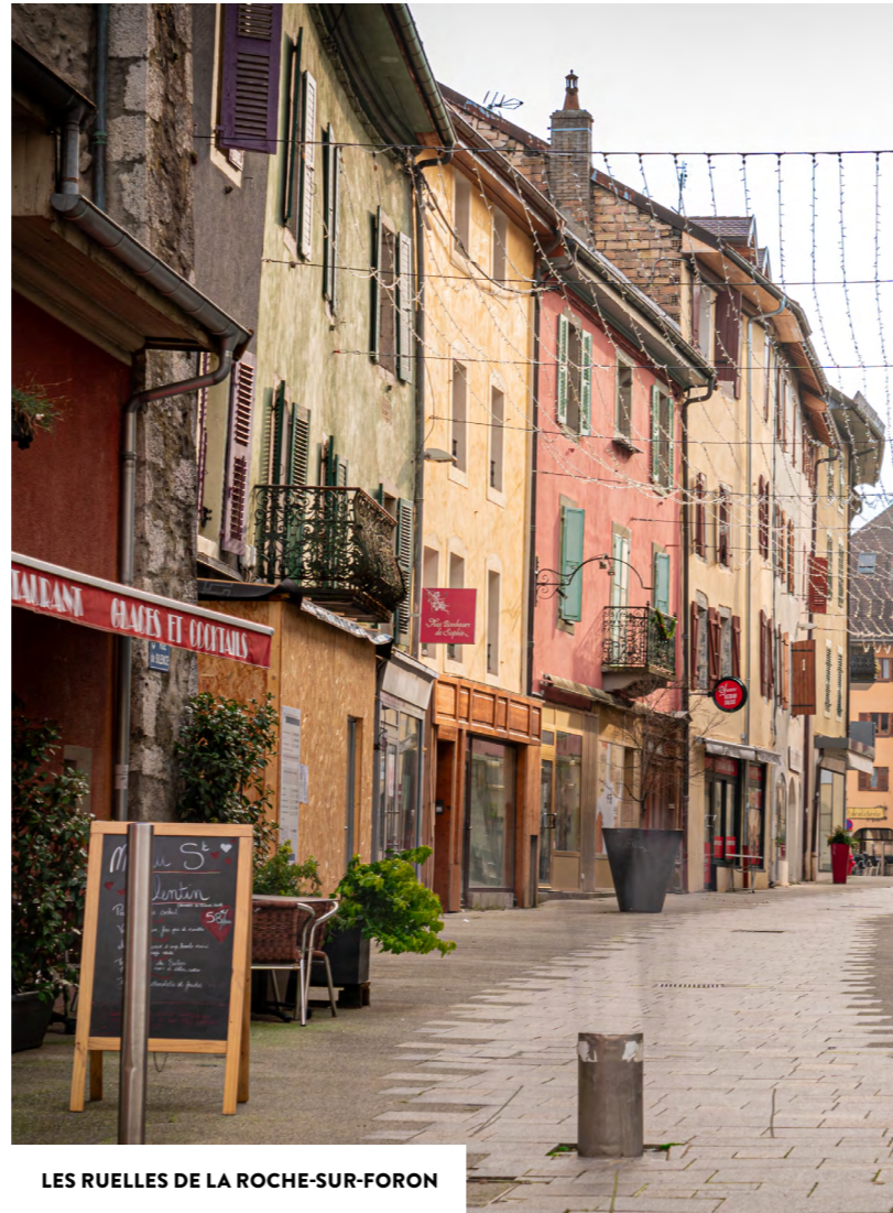
LES RUELLES DE LA ROCHE-SUR-FORON