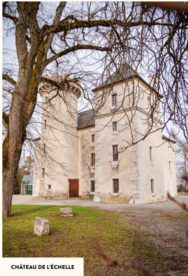
CHÂTEAU DE L'ÉCHELLE

Ruelles pavées, façades de caractère et monuments historiques racontent l'histoire de cette ville millénaire. Le Château de l'Échelle , la Tour des Comtes de Genève ou encore la place de la Grenette sont autant de témoins du passé qui confèrent à La Roche-sur-Foron une atmosphère unique.