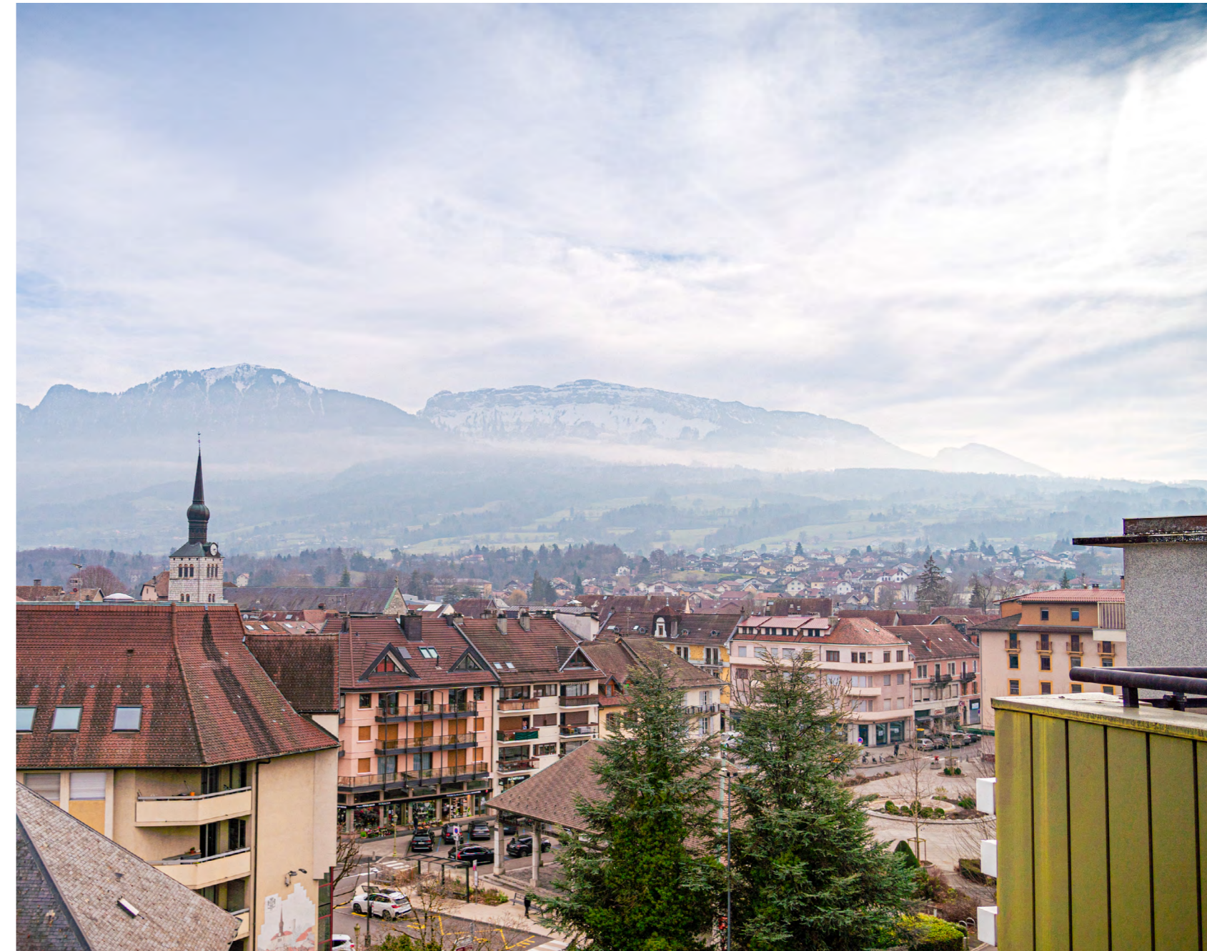
UNE VUE DÉGAGÉE DEPUIS L'IMMEUBLE SUR LES MONTAGNES DE LA ROCHE-SUR-FORON

Adeptes des mobilités douces ? Laissez la voiture de côté et privilégiez les déplacements à pied ou à vélo pour une ville plus agréable !