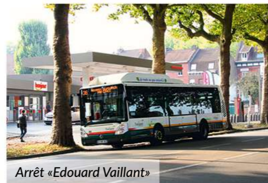
Arrêt «Edouard Vaillant»