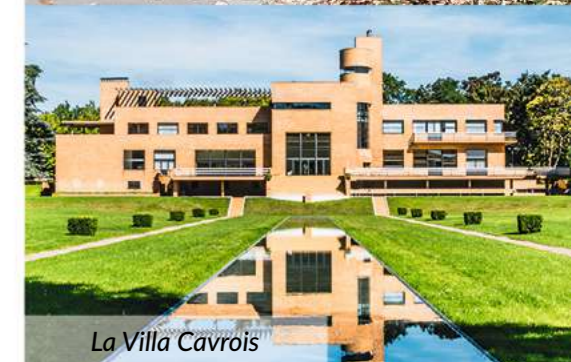
La Villa Cavrois