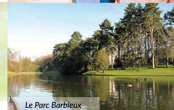
Le Parc Barbieux