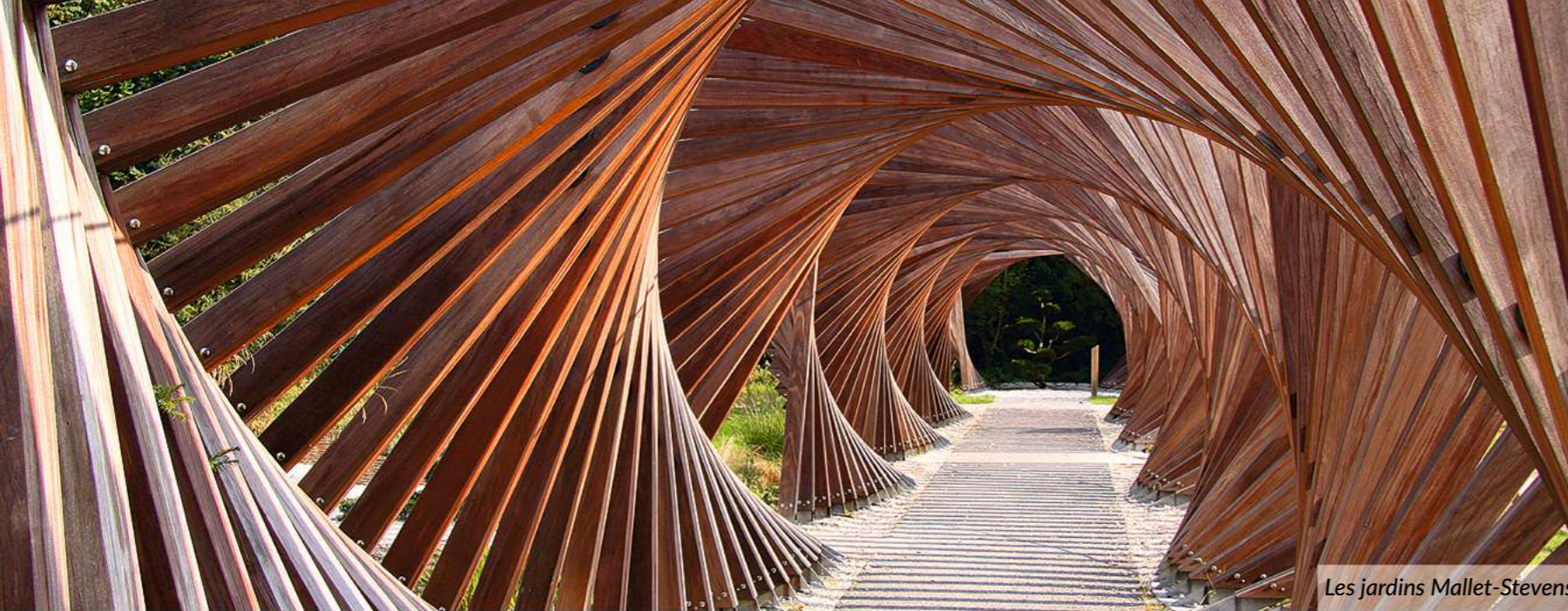
Les jardins Mallet-Stevens