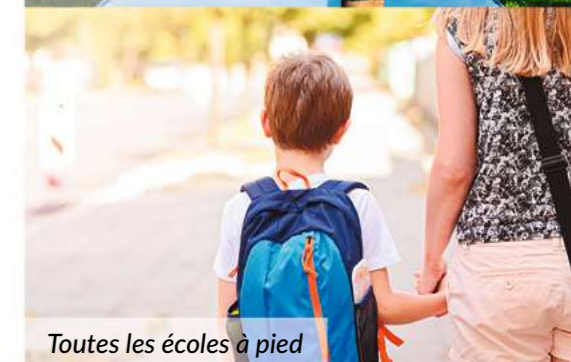
Toutes les écoles à pied