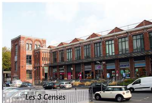
Les 3 Censes