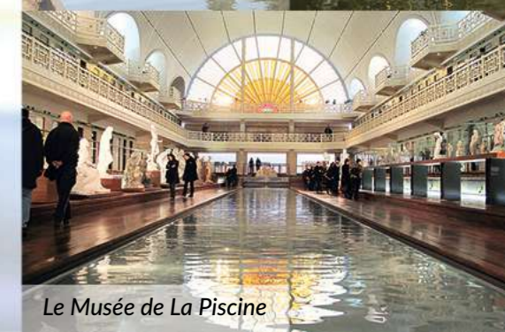
Le Musée de La Piscine