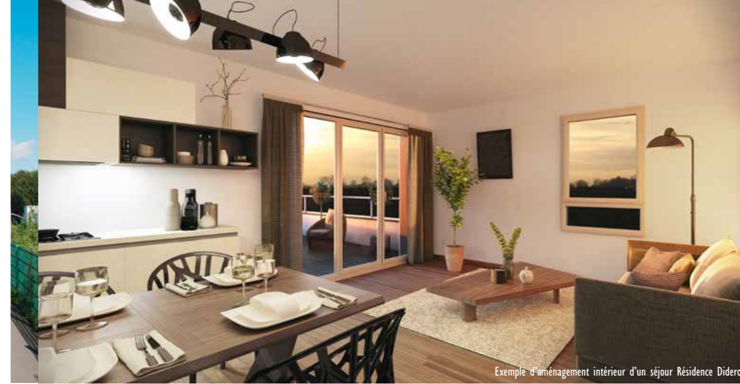
Exemple d'aménagement intérieur d'un séjour Résidence Diderot