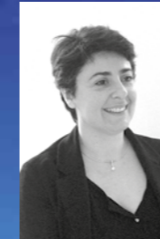
Sophie DENIS Agence AEDIFI