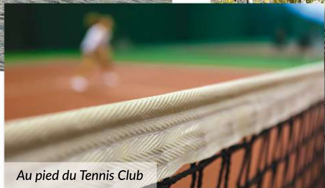
Au pied du Tennis Club

UN ENVIRONNEMENT QUI INCITE À LA BALADE À 2 PAS DU CENTRE DE LILLE