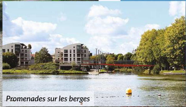
Promenades sur les berges

UN ENVIRONNEMENT QUI INCITE À LA BALADE À 2 PAS DU CENTRE DE LILLE