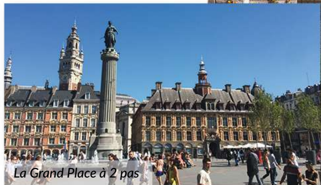
La Grand Place à 2 pas